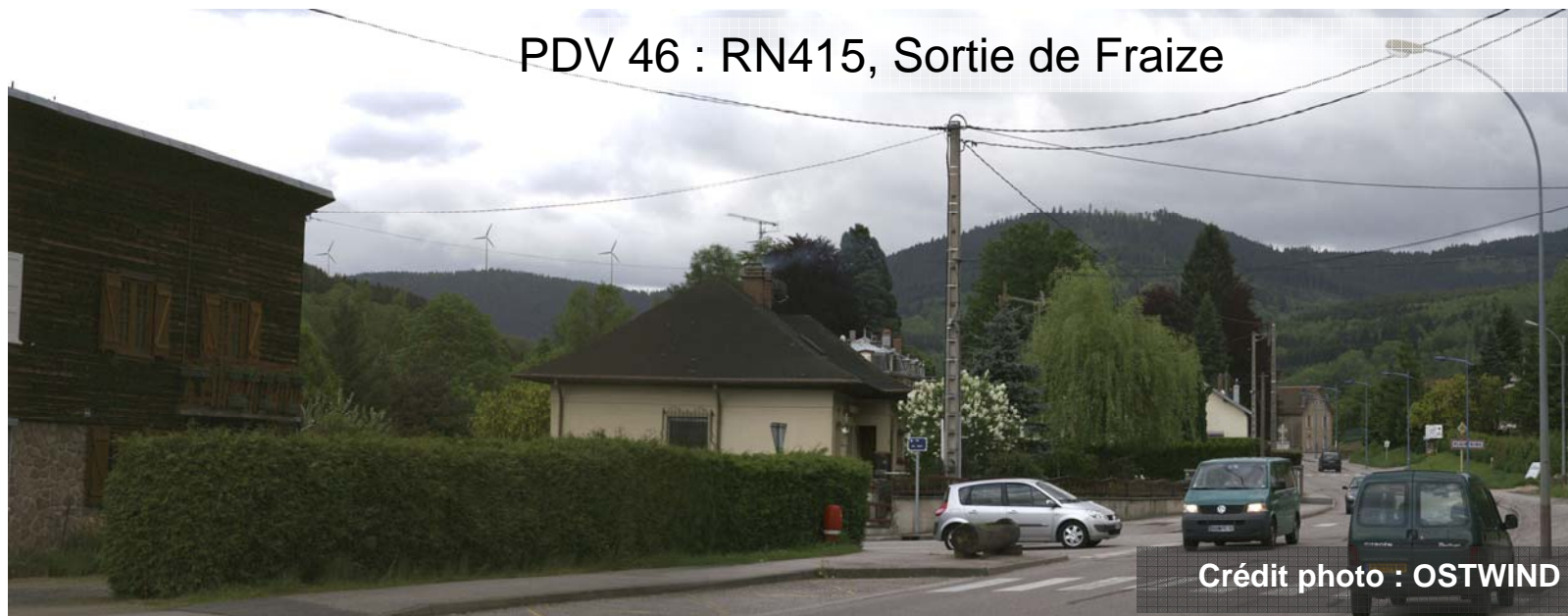
PDV 46 : RN415, Sortie de Fraize