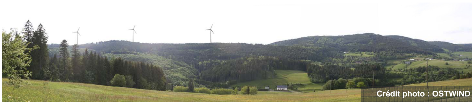
PDV 22 : Point de vue Vallon Béhine La Violette