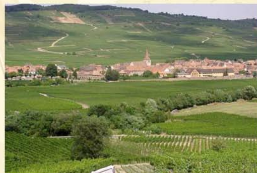
Des paysages modelés à la fois par la nature et par l'homme

La Communauté de Communes de la Vallée de Kaysersberg vous remercie du temps que vous avez consacré à la vallée. Pour nous retourner votre questionnaire :