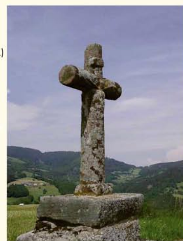
Le calvaire sert à la fois de lieu de mémoire et de point de repère dans le paysage

13 Avez-vous d'autres suggestions ou souhaits à formuler pour l'avenir ?