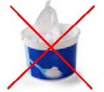
Pots de crème, fromage blanc,...