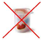
Pots de yaourt