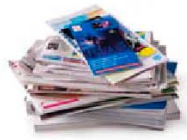
Journaux et magazines