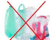
Films et sachets plastiques