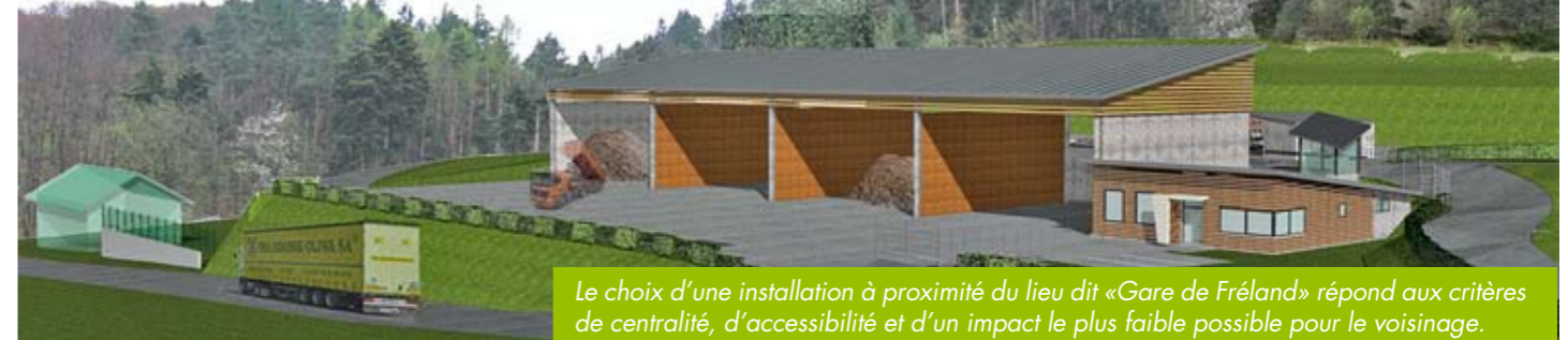
Le choix d'une installation à proximité du lieu dit « Gare de Fréland » répond aux critères de centralité, d'accessibilité et d'un impact le plus faible possible pour le voisinage.

Exploiter une matière première locale, c'est donner du travail à toute une filière économique locale. La CCVK a d'ailleurs porté une