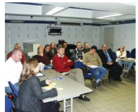
Un des trois ateliers du séminaire consacré à l'évolution du service déchets CCVK - Octobre 2008

L'objectif prioritaire étant de parvenir à une réduction globale des déchets produits tout en maîtrisant les coûts du service.